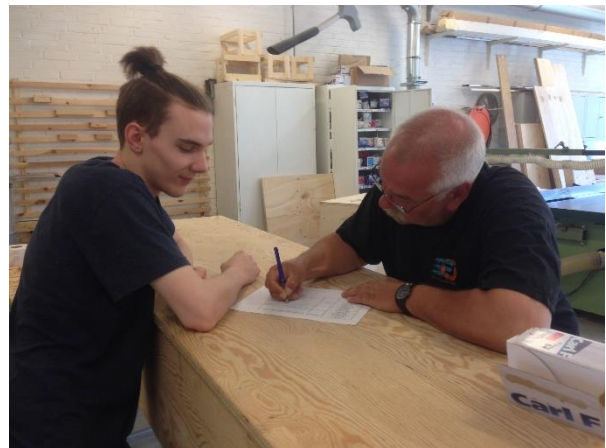
Aalborg Produktionsskole.

Og tak til personale og elever på Produktionshøjskolen Klemmenstrupgaard og Aalborg Produktionsskole for deres gæstfrihed.