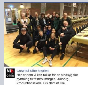
Ni Crew på Nibe Festival Her er dem vi kan takke for en sindsyg flot pyntning til festen imorgen. Aalborg Produktionsskole. Giv dem et like.

Kunsthåndværk på Aalborg Produktionsskole er et dobbeltlærerværksted med plads til 22 elever. Værkstedet påtager sig mange forskellige opgaver, lige fra enkeltstående syopgaver til store produktioner med f.eks. flere tusinde net til samarbejdspartneren Aalborg Kongress & Kultur Center, eller udvikling og produktion af istidslejrplads og 40 istidskostumer i ægte pels til Aalborg Zoo's istidsudstilling. Men værkstedet er også et kunst- og praktisk værksted, der laver malerier, dekorationer, "brugskunst" og rekvisitter på bestilling. Eksempelvis er der sammen med Håndværkslinjen designet og produceret 65 håndmalede 65 trækvogne til Aalborg Zoo. Se også: http://www.produktionsskolen.dk/v%a6rksteder/kunsthandv%a6rk/ og https://www.facebook.com/produktionsskolen/