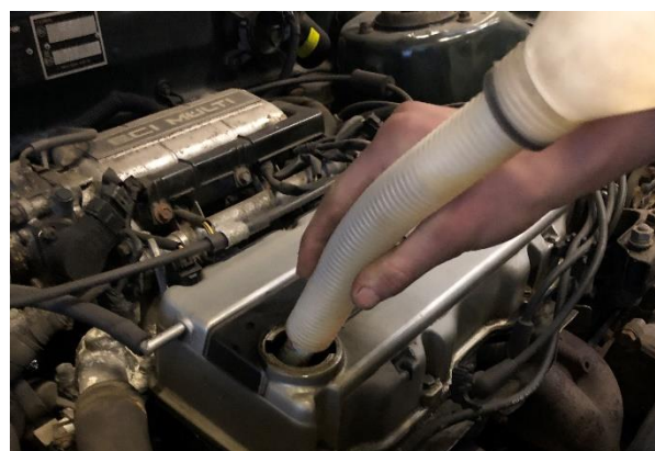
Servicetjek på personbil

Distinktionen har vi fundet hensigtsmæssig både for at synliggøre, hvilke opgaver der er en direkte del af produktionen og for at kunne tilgodese fordybelsen og det nødvendige arbejdsflow i produktionen. Samtidig tilgodeser distinktionen stoffet i de almenfaglige fag, som kan generaliseres og overføres til øvrige opgaver og produktioner. Men det er klart, at grænserne mellem de to kategorier er flydende og afhænger af lærerens fokus i arbejdet med stoffet.