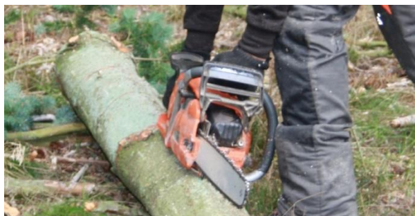
Skovbrug og brændehugst

I juli 2018 fik PSF sammen med en række skoler FGU-midler fra Undervisningsministeriet til at udvikle et undervisnings- og inspirationsmateriale til fagtemaerne i FGUs Produktionsgrunduddannelse.